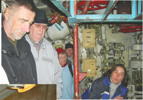
"eine Führung durchs russische U-Boot"