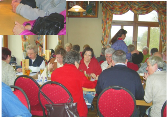
"zum Stintessen in die Lüttenburg"