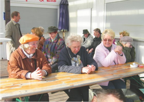
"kurze Rast in der Frühjahrssonne"