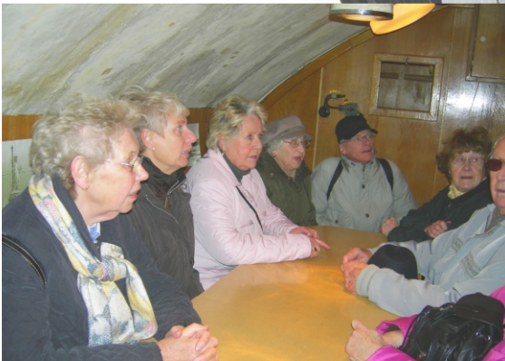
"wir durften auch in der Offiziersmesse Platz nehmen"