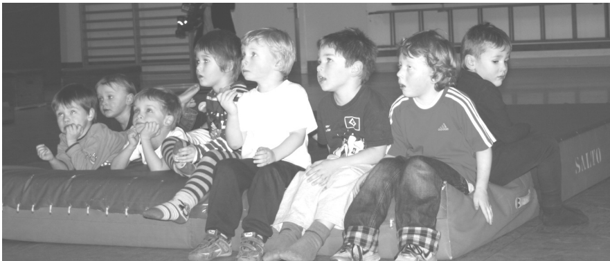
unsere Jüngsten ganz aufmerksam bei Training!